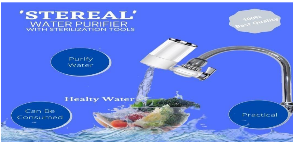
Gambar 1. Prototype Product

Produk kran air STERREAL kami dapat menjadi solusi atas penyelesaian permasalahan yang terjadi di masyarakat. Melalui beberapa proses dalam pengembangan produk, kami juga mengembangkan produk kami berdasarkan revolusi industri 4.0, dimana kami melakukan pemasaran menggunakan e-commerce dan beberapa marketplace . Hal tersebut kami lakukan karena kami mengikuti perkembangan zaman dimana saat ini semua sudah serba online dan memanfaatkan teknologi dalam pengembangannya. Berikut adalah prototype dari produk dari usaha yang kami kembangkan yaitu alat filter kran air “STERREAL” :