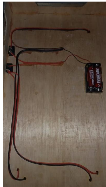
Gambar 6. Rangkaian Listrik

Kemudian berikut bentuk kabel rangkaian listriknya :