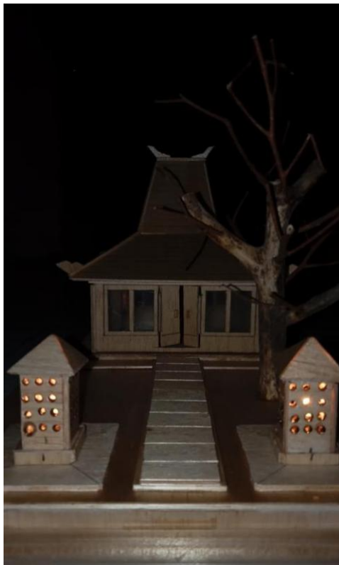
Gambar 4. Rumah Adat. Lampu Paralel

Kemudian berikut gambar rumah adat jika lampu paralel saja yang dinyalakan :