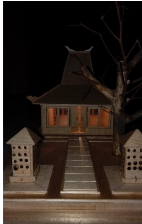
Gambar 5. Rumah Adat. Lampu Seri

Berikut gambar rumah adat jika lampu seri saja yang dinyalakan :