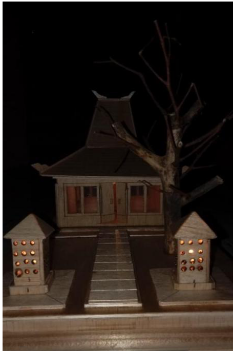
Gambar 3. Rumah Adat, Lampu Seri Paralel

Kemudian berikut gambar rumah adat jika lampu paralel saja yang dinyalakan :